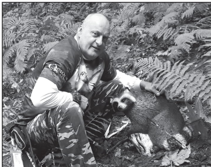
IV Turniej Łuczniczy o Puchar Łowczego, Goraj Zamek 2016, 13 miejsce