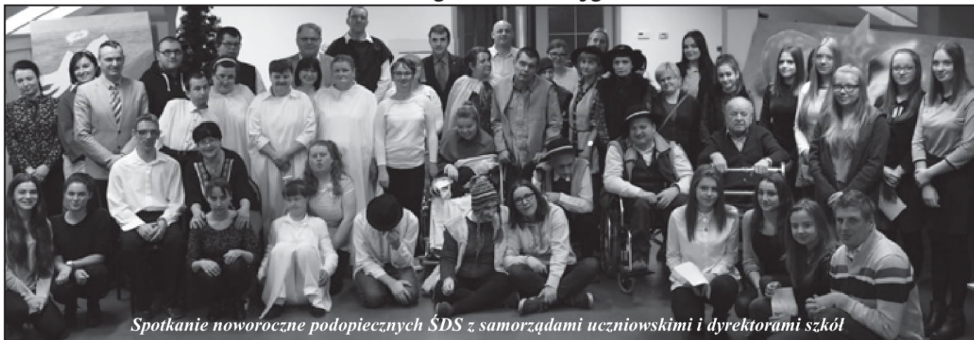
Spotkanie noworoczne podopiecznych ŚDS z samorządami uczniowskimi i dyrektorami szkół

Styczeń minął nam pod hasłem Zimowych Zajęć Feryjnych. Czas bogaty w różnorodne wydarzenia zaplanowane został przez Radę Domu. W pierwszym tygodniu odbyły się zajęcia edukacyjne „Bądźmy ekologiczni dla naszej planety”. Później, na zajęciach z arteterapii, wykonaliśmy kolorowe maski karnawałowe na zajęciach i obejrzelśmy film animowany „Sekretne życie zwierząt domowych”. Ruchu nam także nie zabrakło, a to dzięki zajęciom na śniegu. Drugi tydzień był równie ekscytujący. Najpierw odbyło się w ŚDS spotkanie noworoczne z samorządami uczniowskimi i dyrektorami szkół z terenu naszej gminy. Mili goście obejrzel widowisko jasełkowe „Dlaczego jest Święto Bożego Narodzenia?”, które przygotowaliśmy z okazji minionych świąt. Z kolei w ramach