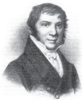
Karol Kurpiński 1785-1857