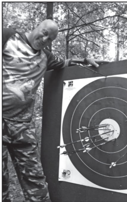
Puchar Polski, Mękarzów 2016 r., 16 miejsce

Jak sama nazwa wskazuje, łuk bloczkowy, oprócz podstawowych elementów, posiada również specjalne bloczki umieszczone na końcu ramion. Pomagają one w napięciu cięciwy i w porównaniu do łuku klasycznego zmniejszają siłę naciągu o ok. 60-70%. Dzięki temu nie tylko łatwiej się celuje, ale również operuje łukiem, który jest znacznie mniejszy od tradycyjnego i przez to lepiej sprawdza się na polowaniach oraz pewnych odmianach zawodów.