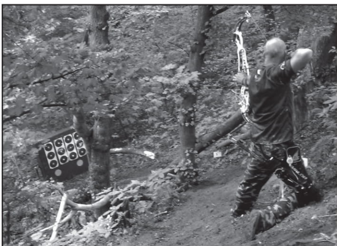
Puchar Polski, Legnica 2016 r., 18 miejsce

Iu zawodach wymagają białej odzieży lub kamuflażu leśnego. Co jakiś czas sprzęt wymaga również pewnych modyfikacji i okresowych przeglądów, a jak chce się startować w zawodach, to trzeba opłacić składkę członkowską w Polskim Związku Łuczniczym.